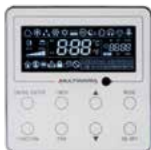
M-V-CW-HB2-G Opzionale per tutte le tipologie di unità interne

Pannello semplificato particolarmente indicato per applicazioni alberghiere. Display LCD monocromatico retroilluminato. Design moderno, linee squadrate. Comando remoto molto semplice e intuitivo per l'utente e con funzioni semplificate. Possibile collegamento con sistemi automatici di gestione degli accessi.