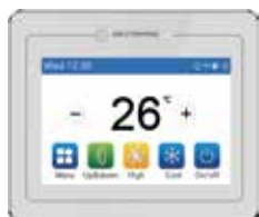
M-V-CW-TW1-G Opzionale per tutte le tipologie di unità interne

Pannello Smart touch screen con display LCD ad alta risoluzione. Design elegante, linee squadrate. Comando remoto molto evoluto completo di diverse funzioni, ciascuna visualizzabile in una singola schermata interattiva e di semplice gestione.