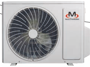
MCKGM 402 Z2 MCKGM 532 Z2