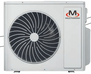
MCKGM 1202 Z5