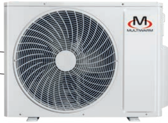
MCKGM 602 Z3 MCKGM 712 Z3 MCKGM 822 Z4