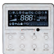
M-V-CW-HB2-G Opzionale per tutte le tipologie di unità interne

Pannello semplificato particolarmente indicato per applicazioni alberghiere. Display LCD monocromatico retroilluminato, pulsanti meccanici. Design moderno, linee squadrate, con pannello frontale lucido effetto vetro. Comando remoto molto semplice e intuitivo per l'utente e con funzioni semplificate. Possibile collegamento con sistemi automatici di gestione degli accessi.