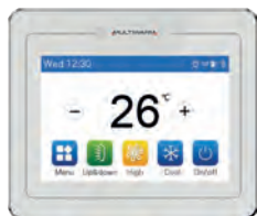
M-V-CW-TW1-G Opzionale per tutte le tipologie di unità interne

Pannello Smart touch screen con display LCD ad alta risoluzione. Design elegante, linee squadrate. Comando remoto molto evoluto completo di diverse funzioni, ciascuna visualizzabile in una singola schermata interattiva e di semplice gestione.