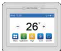
M-V-CW-TW1-G Opzionale per tutte le tipologie di unità interne

Pannello Smart touch screen con display LCD ad alta risoluzione. Design elegante, linee squadrate. Comando remoto molto evoluto completo di diverse funzioni, ciascuna visualizzabile in una singola schermata interattiva e di semplice gestione.