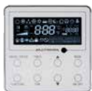
M-V-CW-HB2-G Opzionale per tutte le tipologie di unità interne

Pannello semplificato particolarmente indicato per applicazioni alberghiere. Display LCD monocromatico retroilluminato, pulsanti meccanici. Design moderno, linee squadrate, con pannello frontale lucido effetto vetro. Comando remoto molto semplice e intuitivo per l'utente e con funzioni semplificate. Possibile collegamento con sistemi automatici di gestione degli accessi.